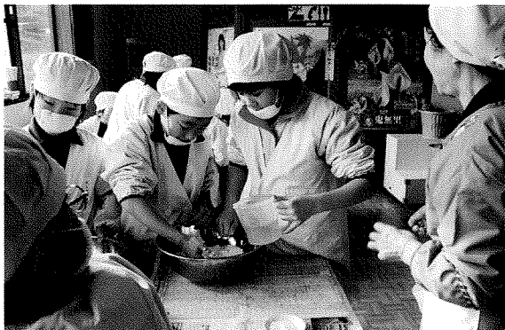
「水の量は これ位かな？」 (おやきを教わろう)