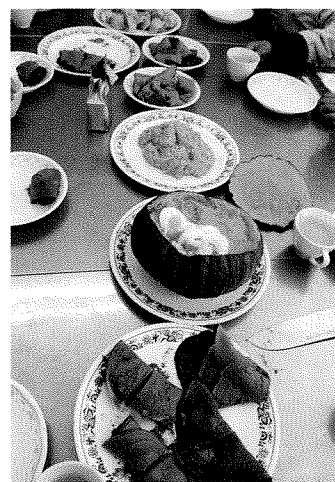
「わあっ おいしそう」