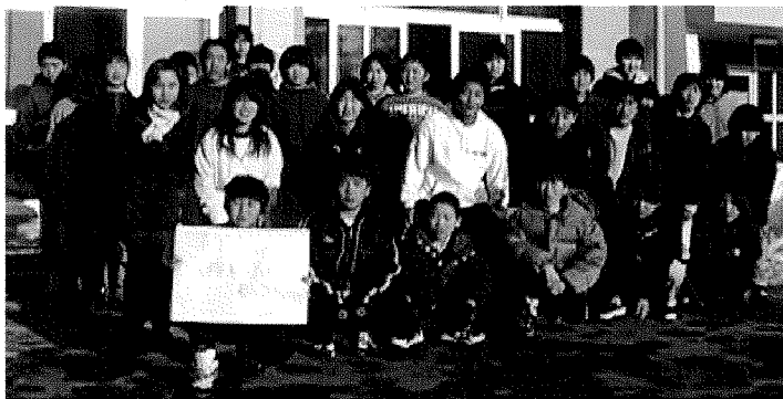
子どもは人権の主体者（権利条約できたよ！）