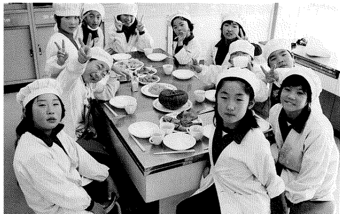
「かぼちゃ料理できたよ！」