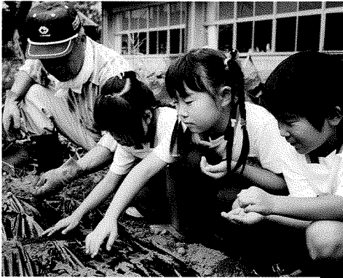
畑の先生とたねまき