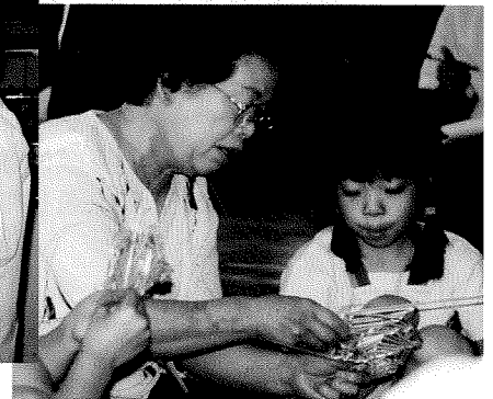
むぎさんのへんしん 「そうそうじょうずだよ」