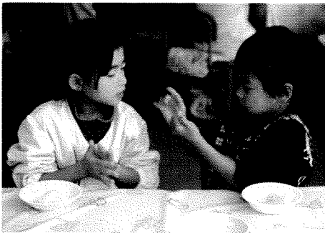
保育園のおともだちとお月見会 「手にくっついちゃう」