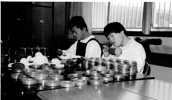
キャップの交換は任せてくれ