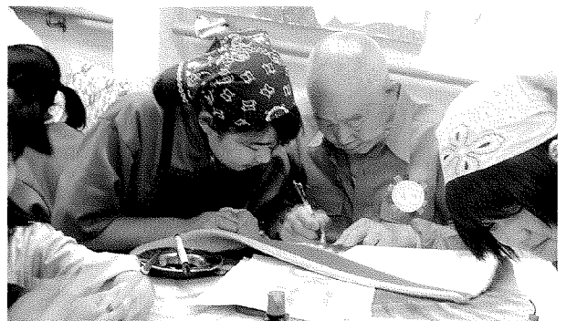
ここはこうすればいいんだよ。