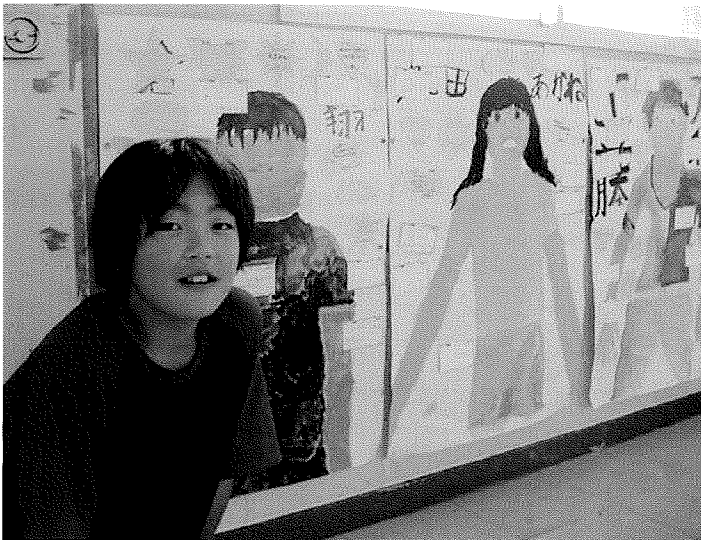
見て！ 自画像ができたよ！