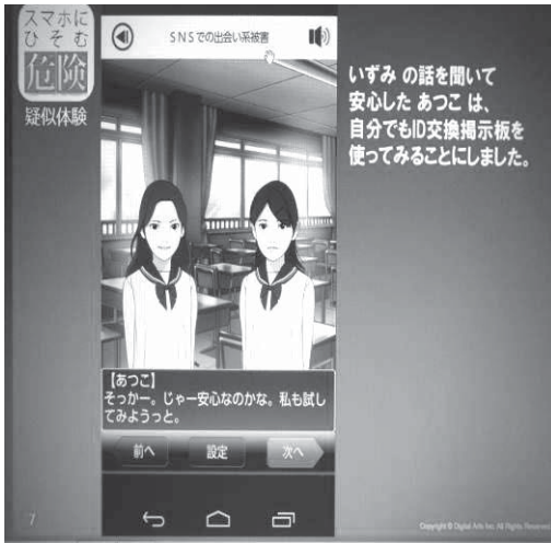
デジタルアーツ社制作のPDF ファイル