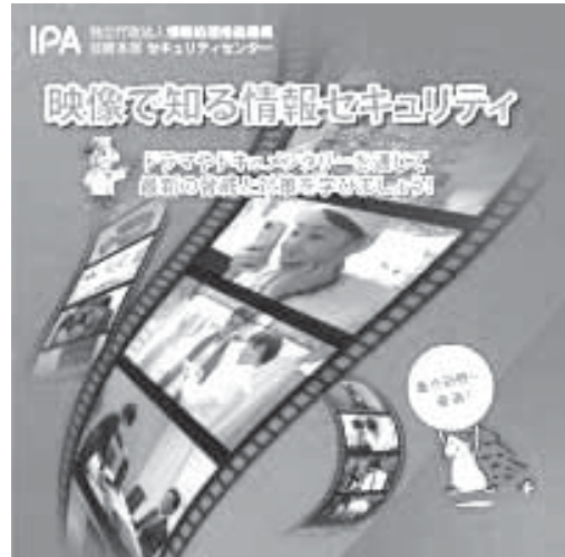
IPA（情報処理推進機構）作成のDVD