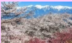
(高遠公園の桜と中央アルプス)

は、諏訪湖周辺および天竜川流域に位置し、北を八ヶ岳連峰、西に中央アルプス、東に南アルプスを臨む自然豊かな美しい地域です。東京や名古屋への交通アクセスも整っています。古くからそれぞれの地域に根ざした文化が人々の生活と共に脈々と受け継がれています。