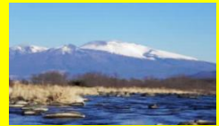
(冬の千曲川と浅間山)

は、佐久地域と上田小県地域に分けられます。千曲川・浅間山・八ヶ岳連峰の豊かな自然に囲まれ、新幹線など高速交通網が発達しています。ブランド化された農産物、先進技術を誇る工業、文化でも国際化が進み、「多様性」に富んだ魅力と夢にあふれた地域です。