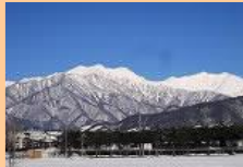
(学校から望む冬の北アルプス)

は、北アルプス・御嶽山の麓、南北140kmに連なる地域です。安曇野の水田、松本の城下、塩尻のワイン醸造地、木曾路の町並み等、各地の気候・風土を背景にした、豊かな「ひと・もの・こと」が息づいています。スポーツや芸術も盛んで多様な文化に触れることができます。