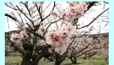
(千曲市 あんずの里)

は、上信越高原国立公園の山々に囲まれ、千曲川中流の豊かな流れのもとに広がる地域です。この自然環境の中で、様々な産業が営まれ、善光寺をはじめ多くの観光地・温泉地・伝統文化・おいしい食べ物等、多彩な魅力にあふれています。県庁所在地・長野市を中心として経済・交通が発展しています。