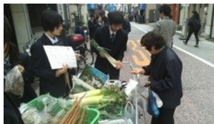
飯田市の「地域人教育」より

若者が地域づくりに関わることにより、地域の担い手として育っている事例が、長野県の各地に見られます。そこでは、取り組みの推進役や調整役として、公民館が重要な役割を果たしています。この講座では、そのような取り組みを支援している講師をお迎えし、若者と地域をつなぐ公民館の可能性について学びます。