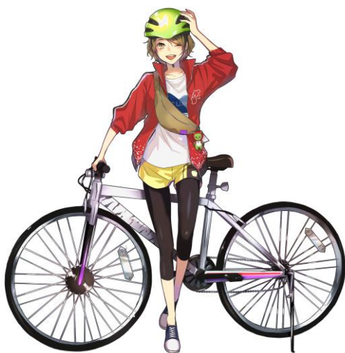
長野県自転車安全・安心PRキャラクター 風野りん イラスト/雨宮理真