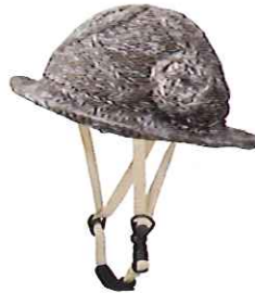
品番C612: ¥7,600税抜き (ヘルメット・帽子セット価格) 品番C312: ¥3,800税抜き (帽子のみ) SIZE:S M