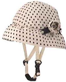
品番C621: ¥7,600税抜き (ヘルメット・帽子セット価格) 品番C321: ¥3,800税抜き (帽子のみ) SIZE:S M