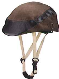
品番C642: ¥7,600税抜き (ヘルメット・帽子セット価格) 品番C342: ¥3,800税抜き (帽子のみ) SIZE:S M