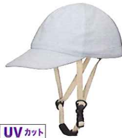
UVカット 品番C634: ¥7,200税抜き (ヘルメット・帽子セット価格) 品番C334: ¥3,500税抜き (帽子のみ) SIZE:S M