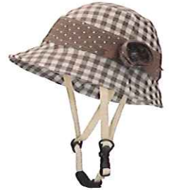
品番C622: ¥7,600税抜き (ヘルメット・帽子セット価格) 品番C322: ¥3,800税抜き (帽子のみ) SIZE:S M L