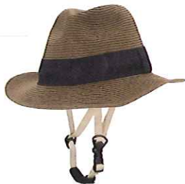
品番C810: ¥6,800税抜き (ヘルメット・帽子セット価格) 品番C410: ¥3,200税抜き (帽子のみ) SIZE:M