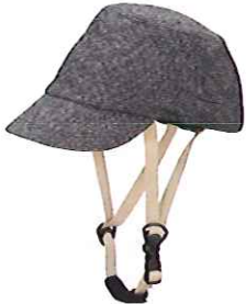
品番C605: ¥7,200税抜き (ヘルメット・帽子セット価格) 品番C305: ¥3,500税抜き (帽子のみ) SIZE:S M L