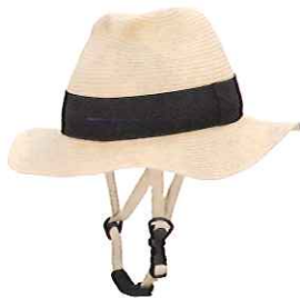
品番C810: ¥6,800税抜き (ヘルメット・帽子セット価格) 品番C410: ¥3,200税抜き (帽子のみ) SIZE:M