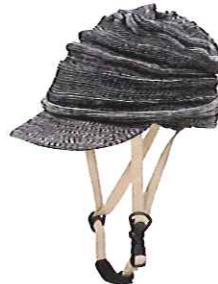
品番C840: ¥6,800税抜き (ヘルメット・帽子セット価格) 品番C440: ¥3,200税抜き (帽子のみ) SIZE:S M L