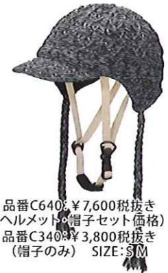
品番C640: ¥7,600税抜き (ヘルメット・帽子セット価格) 品番C340: ¥3,800税抜き (帽子のみ) SIZE:S M