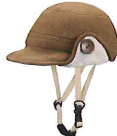
品番C641: ¥7,600税抜き (ヘルメット・帽子セット価格) 品番C341: ¥3,800税抜き (帽子のみ) SIZE:S M