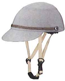
品番C631: ¥7,200税抜き (ヘルメット・帽子セット価格) 品番C331: ¥3,500税抜き (帽子のみ) SIZE:S M