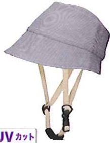
UVカット 品番C624: ¥7,600税抜き (ヘルメット・帽子セット価格) 品番C324: ¥3,800税抜き (帽子のみ) SIZE:S M