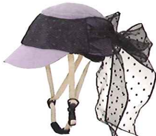
品番C620: ¥7,600税抜き (ヘルメット・帽子セット価格) 品番C320: ¥3,800税抜き (帽子のみ) SIZE:S M