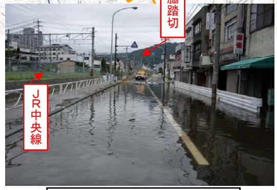
② 上諏訪駅付近冠水(H18豪雨)