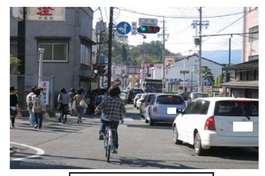
B 元町交差点の交通状況