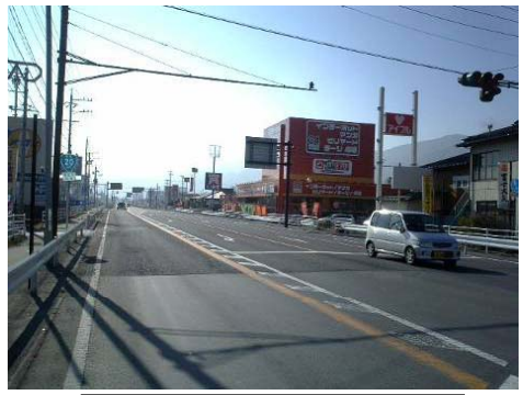
D 諏訪バイパス(飯島交差点)