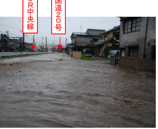
① 承知川付近冠水(H18豪雨)