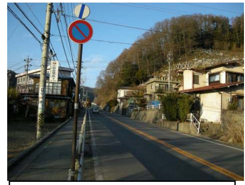
A 下諏訪町東町地国道142号 交差点