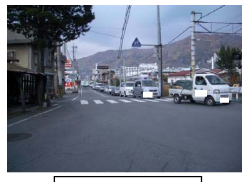
C 湯の脇踏切の交通状況