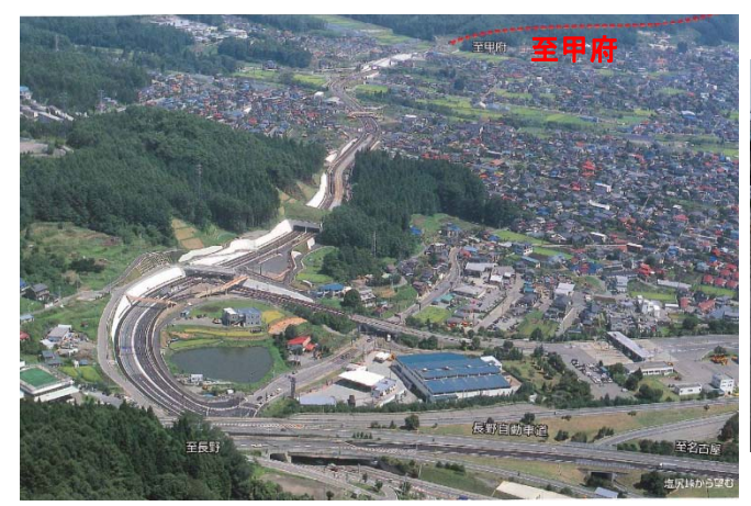
下諏訪岡谷バイパス供用状況