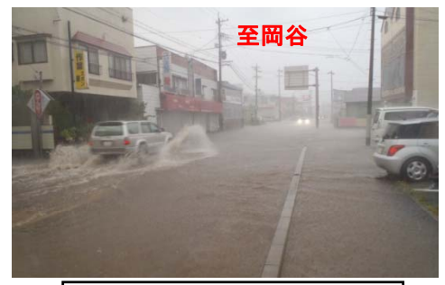
③ 諏訪市四賀武津付近冠水(H23)