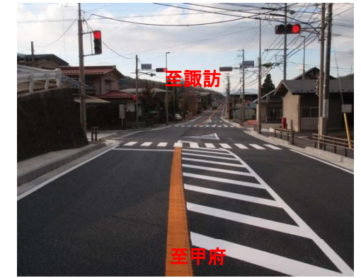
富士見パノラマスキー場入口交差点改良