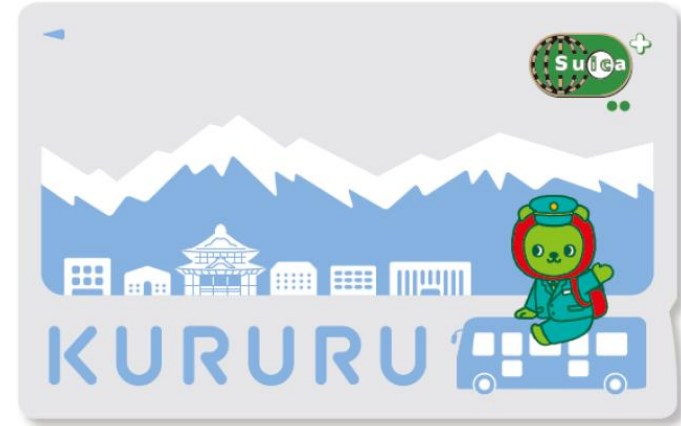
長野市公共交通活性化・再生協議会で決定したデザイン