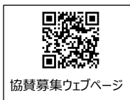
協賛募集ウェブページ