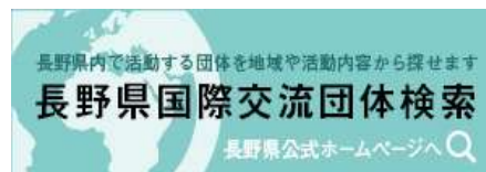
アンピHPトップページ画像