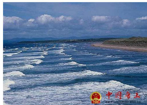
唐山湾国際旅遊島