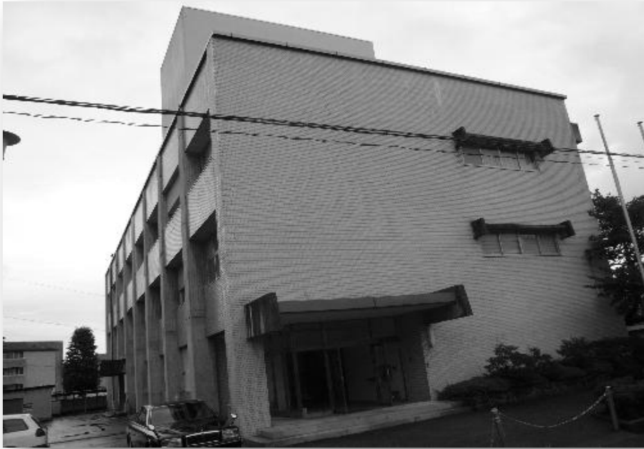
(旧公衆衛生専門学校長野校舎)