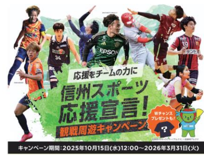
お得に試合を観戦できる 周遊キャンペーンを実施中！ (～3/31)