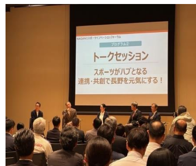
NAGANOスポーツ イノベーションフォーラムの様子 (10/14開催)