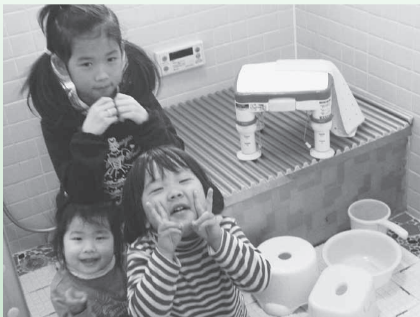
「お風呂がついたよ。ありがとう」 (詳しくは、3ページをご覧ください。)