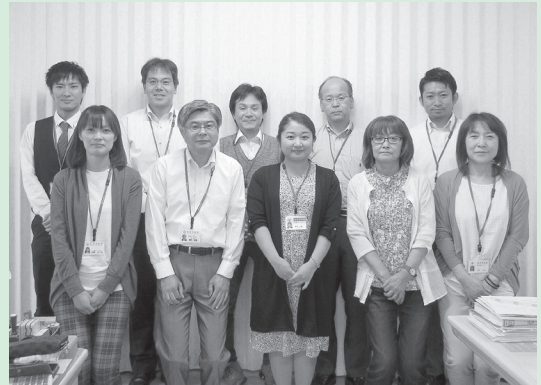
松本市市民活動サポートセンターの皆さん

お問い合わせ TEL/FAX 0263-88-2988 E-mail support-center@support-center.jp