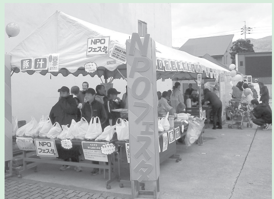
飯山えびず講と同時開催のNPOフェスタの様子

お問い合わせ TEL/FAX 0269-62-7030 E-mail npo@iiyama-catv.ne.jp