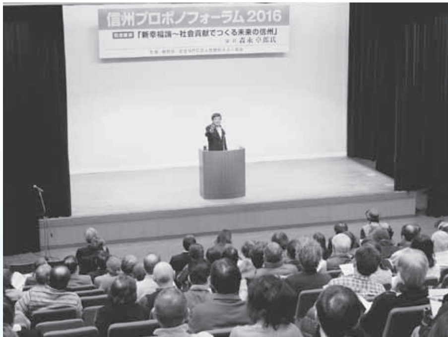
信州プロボノフォーラム 2016 で講演する森永卓郎氏