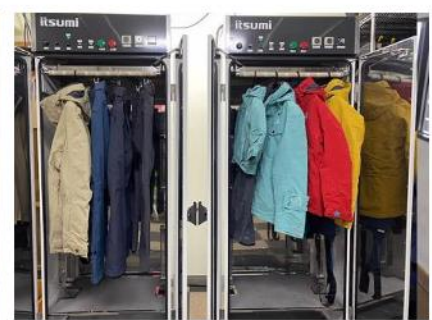
レンタルウェアの消毒