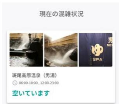
大浴場の混雑状況がわかる HP