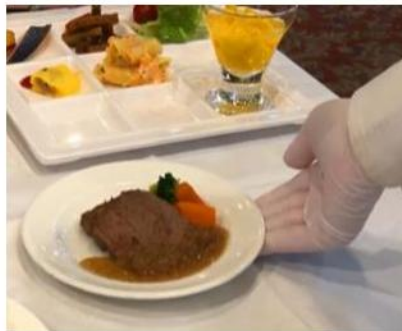
ゴム手袋を着用し食事提供