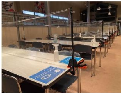
対面にパーテーション設置