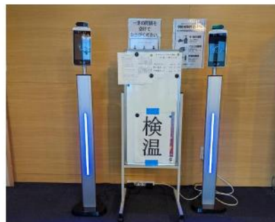
サーモカメラと感染予防の掲示