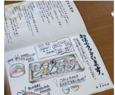
手書きメニューで料理説明