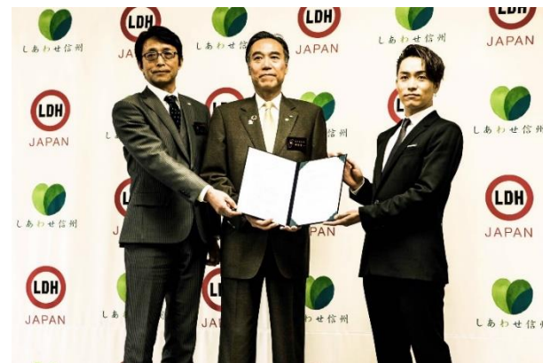
2019.3 包括連携協定の締結