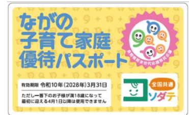
ながの子育て家庭優待パスポート