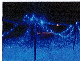
ナイトパーティー