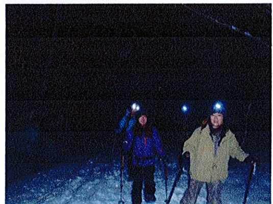
ナイトツアー浅間山