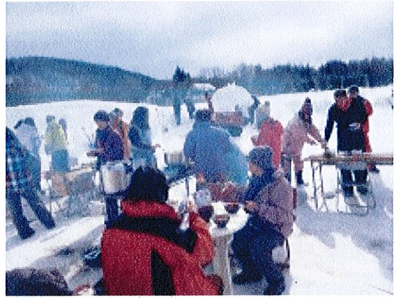
雪上バーベキュー