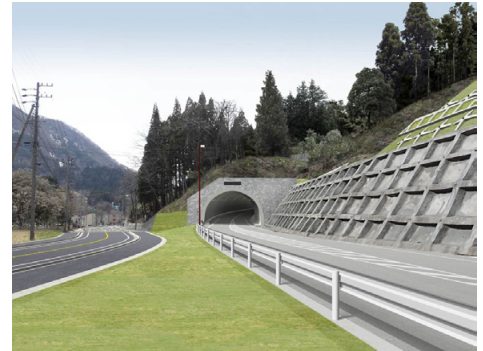
雨中2号トンネルの坑口部