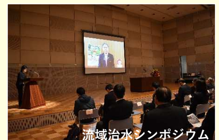
流域治水シンポジウム