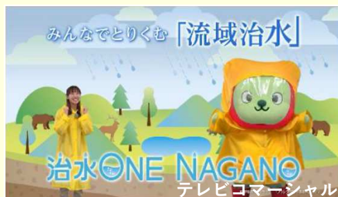
テレビコマーシャル