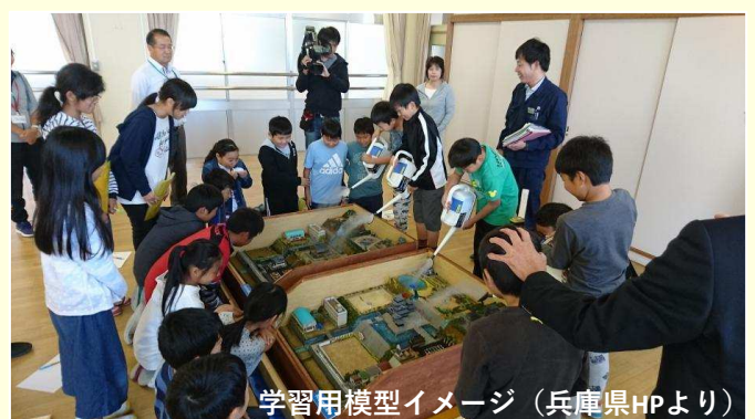
学習用模型イメージ