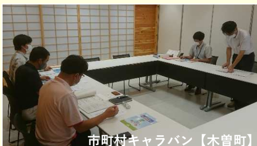
市町村キャラバン【木曾町】