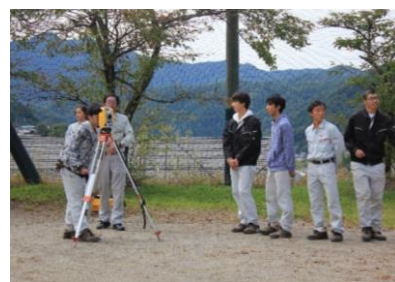
測量機器を用いて測量作業の研修を行う生徒たち

生徒約20名が参加した実技講習では、ドローンのデモフライトの見学や、最新機器を用いた測量作業の体験学習を行いました。