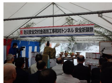
安全祈願祭の様子

木曾川右岸道路の上松町登玉～大桑村和村間で計画している和村トンネル(351メートル)の工事安全祈願祭が、工事関係各社の主催で建設事務所や地元町村関係者が出席して行われました。木曾川右岸道路が早期に供用できるように、工事の安全と早期の完成を誓いました。