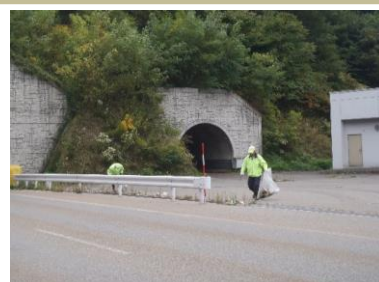
ひとつひとつ手で拾います