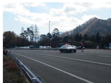
約1時間通行止めにして訓練を行いました