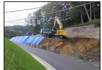
施工の状況(既設道路の掘削)