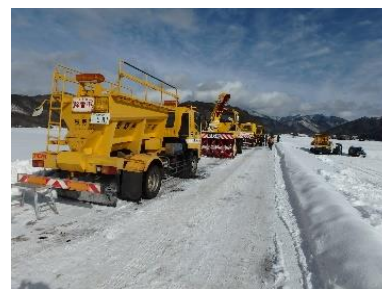
色々な種類の除雪機械を展示しました

開田高原で毎年開催されている「かまくらまつり」に参加し、ロータリ除雪車や凍結防止剤散布車などの試乗体験を行いました。普段触れることの無い除雪車などに乗車してもらい、除雪作業に対する理解を深めていただきました。