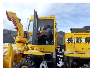
小さなお子さんを中心に大勢の方に試乗していただきました