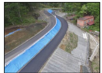
施工の状況(谷側の盛土完成)