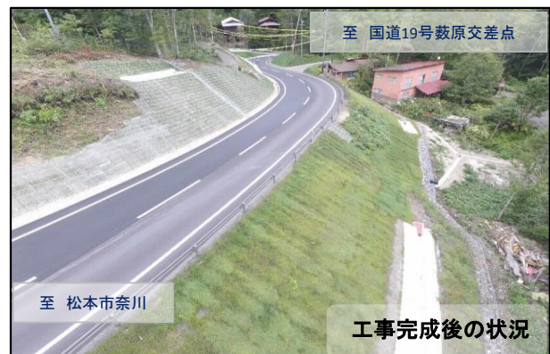
工事完成後の状況

木曾建設事務所では、管内木曾郡6町村の道路、河川の維持管理を行っています。道路にできた穴や、詰まった側溝など、お気づきの点がありましたら、下記まで連絡をお願いします。