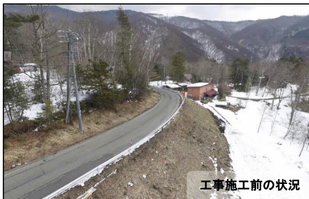
工事施工前の状況