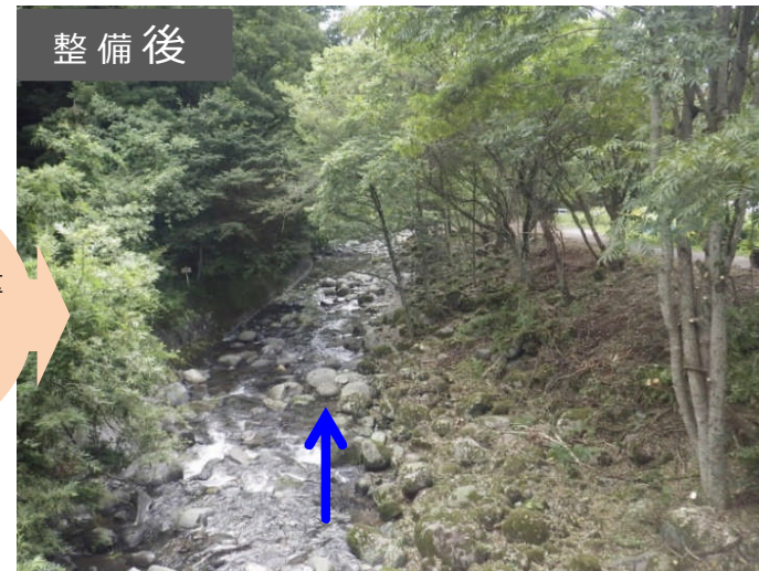
危険木除去により、 安全・安心で景観も良好