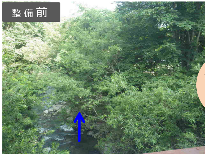
倒木や細く倒れやすい木が多く、 豪雨時に危険!!