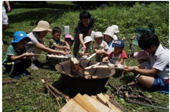
「森のこども会」の活動風景（棒パンづくりの様子）

子育ての悩みや希望を共有できる場をつくり、行政などとも連携し子育て環境をよりよくするための活動（親子イベントの開催、子育て情報の発信、行政との協働による子育てまちづくり活動）を行っています。