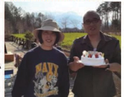
経営者の14代目女将と専務