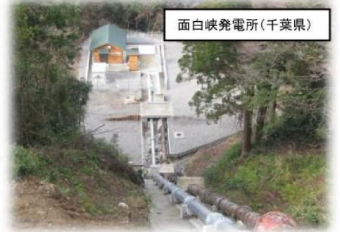
面白発電所(千葉県)

発電所を建設するのにふさわしい場所か調べるため「測水」や「河川・地形測量」などの適地調査から始めます。その次に、「詳細地形図の作成」や発電所の「電気設計」「CADによる土木設計」そして発電所建設を行っています。