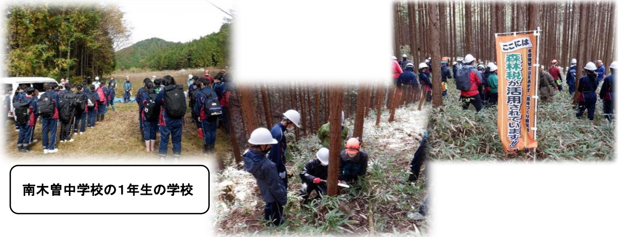
南木曾中学校の1年生の学校