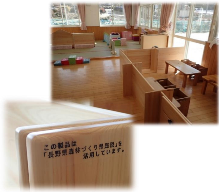
読書保育園（南木曾町） 整理棚、間仕切りパネルの設置