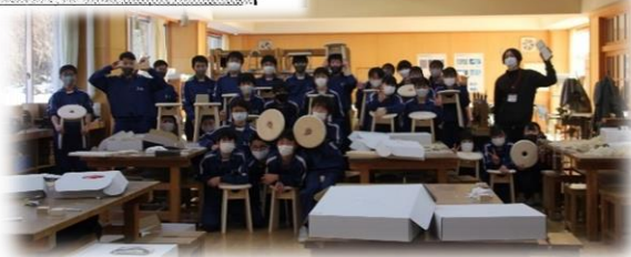
上松中学校（3年）で総合学習の時間を活用した木曾ヒノキ小椅子づくり（上松町）

子どもや若者が木に触れ合うことを通じて、森林の大切さや県産材の利用に理解ある地域づくりを進めます。