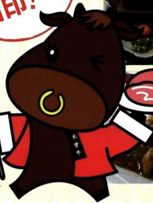
木曾牛キャラクター きそまる