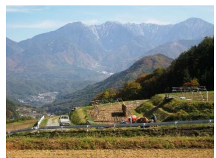
狭小な区画が多い上松町高倉地区の水田