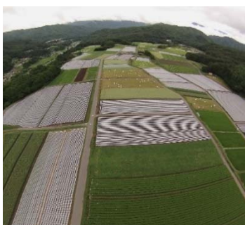
整備した木祖村西山地区の「御嶽はくさい」ほ場と収穫作業

南木曽町、上松町、木曽町（福島、日義、三岳）は、狭隘な谷合に形成された小規模な水田が多く、中山間総合整備事業によりほ場整備を行っていますが、未整備の農地も多く残っています。