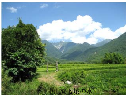
中山間地域の水田