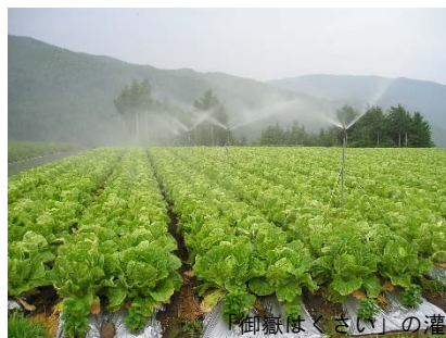
「御嶽はくさい」の灌水