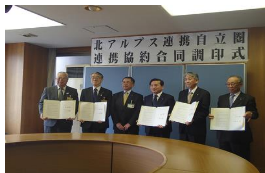
北アルプス連携自立圏連携協約 合同調印式（H28.3.29）