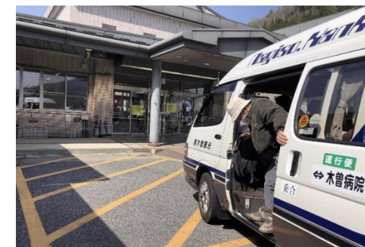
広域路線バスの共同運行