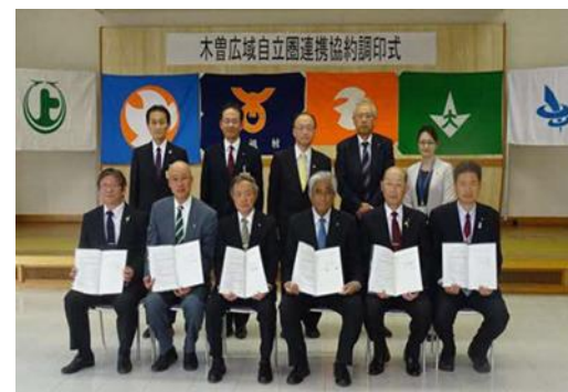
木曾広域自立圏連携協約 合同調印式(H30.3.29)