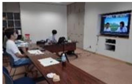
オンライン移住セミナー の様子