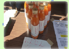
(ネットで販売で扱っているニンジンジュース)

例 古田ゼミ内でネット販売会社を起業 ❖有機農家から商品を預かりネットで販売 ❖商店街での有機野菜イベント販売を計画、運営