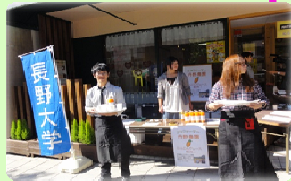
(松尾町でのイベント販売)