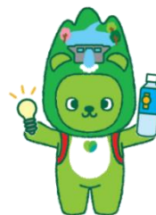
長野県PRキャラクター『アルクム』