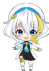
長野県企業局PRキャラクター『水望めぐ』