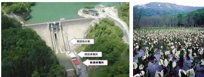
水芭蕉発電所 (長野市) (出力999kW 約1,400世帯分を発電)