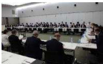
市町議会合同勉強会 R4.9.22