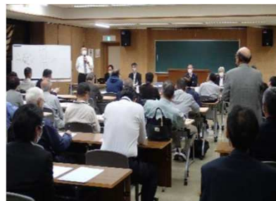
住民説明会（坂城町）R4.10.6