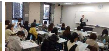
長野県立大学への訪問授業 R5.1.11