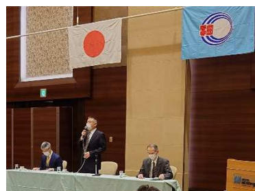
県営水道工事業組合への説明 R4年度 3回

今後も説明会等を開催し、様々な世代に、より丁寧な説明を継続するとともに、この地域にとってより良い水道の在り方について、引き続き検討