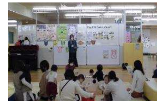
子育て世代向け説明会（長野市）R5.1.13