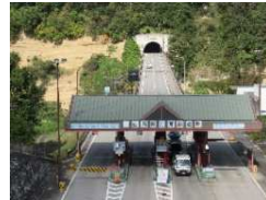
料金所（白馬長野有料道路）