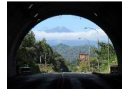
日高トンネルから白馬方面を臨む