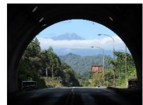
目高トンネルから白馬方面を臨む