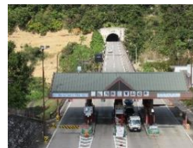
料金所（白馬長野有料道路）