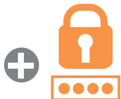
利用者証明用 パスワード (4桁)