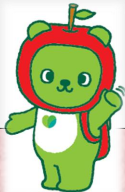
長野県PRキャラクター 「アルクマ」©長野県アルクマ