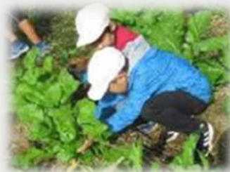
野沢菜収穫・漬物作り