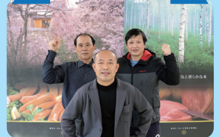
株式会社信州ハム・サービス ※本年はサキベジ大賞の開催はありません