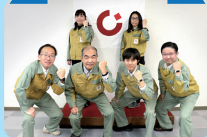
中部電力パワーグリッド株式会社 長野支社塩尻電力センター