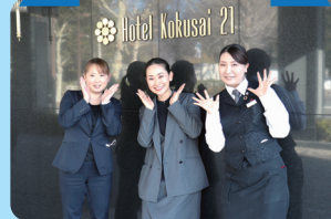
ホテル国際21株式会社