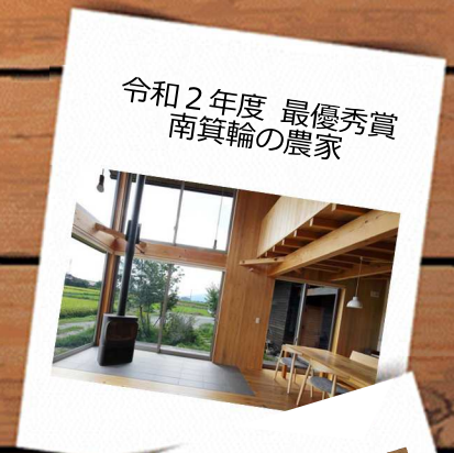
令和2年度 最優秀賞 南箕輪の農家