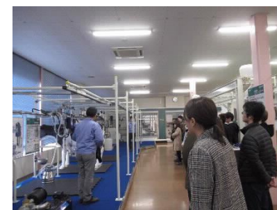
[GM学科による企業訪問の様子]

県内企業等との連携を通じて学生の学修機会を充実させることにより、プログラム後の学修成果の共有や、本学の産学連携促進に寄与することが期待できる。