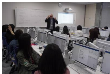
[CALL教室での授業の様子]

1年次と2年次の必修科目として英語集中プログラムを実施した。CALLシステム（コンピュータを活用した外国語学習）も利用しながら、正確な英語運用能力を高める科目と英語コミュニケーション能力を高める科目の両方を履修することにより、バランスよく実践的な英語力を養成し、また、「読む・聞く・書く・話す」の4技能融合型の授業によって、4技能を有機的に使いこなす力を身に付けている。