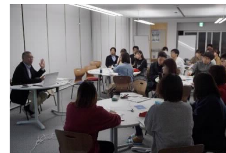
【象山未来塾の様子】

寮での学習サポートの一環として、キャリアセンター主催の「象山未来塾」を計7回開催し、延べ129人が参加した。象山未来塾は、教員や企業、地域住民をゲストに寮生と語り合い、イノベーションの思想に触れることで、自分のキャリアを考えるための教育課程外プロジェクトとして位置付けている。参加者の満足度は100%（終了後のアンケートより）と高い学習効果を上げることが出来た。