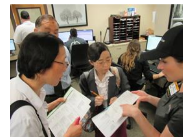
[ミズーリ大学コロンビア校・現地視察]