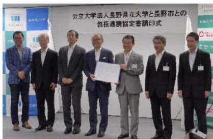
[包括連携協定（長野市）]