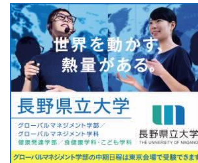
[サーチャータゲティング広告]

また、ターゲットを絞ったサーチャータゲティング広告（本学と競合する大学をWEB検索した18-21歳ユーザー（受験生）に対し、広告が表示される）や新聞系出版社が発行する進学情報誌への特集記事（朝日新聞出版・AERA）の掲載など、知名度向上のための取組を行った。