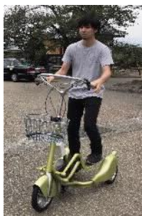
[ウォーキングバイシクル]