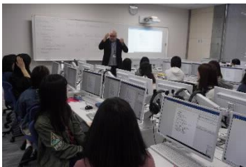
[CALL教室での授業の様子]

1年次と2年次の必修科目として英語集中プログラムを実施した。CALLシステム（コンピュータを活用した外国語学習）も利用しながら、正確な英語運用能力を高める科目と英語コミュニケーション能力を高める科目の両方を履修することにより、バランスよく実践的な英語力を養成し、また、「読む・聞く・書く・話す」の4技能融合型の授業によって、4技能を有機的に使いこなす力を身に付けている。