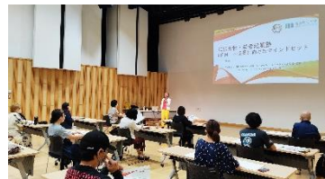
[KISO 女性・若者起業塾]

このほか、県北信地域振興局「地域おこし協力隊起業塾」、県木曾地域振興局による女性・若者を対象とした「KISO女性・若者起業塾」の実施を支援し（チーフ・キュレーターによる講義）、女性や若者、地域おこし協力隊による社会的起業を促進した。