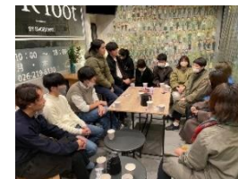
[ついたち会の様子]