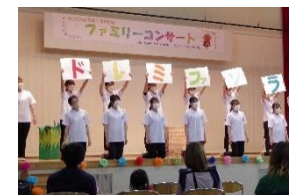
[飯綱町ファミリーコンサートの様子]

さらに毎月、保育士、子育て支援センター職員の保育・子育てに関する合同研修会に本学教員2名がアドバイザーとして参加した。