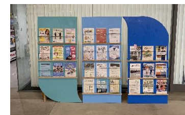
[県産木材を使用して作成したパンフレットラック]