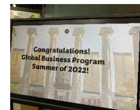
[オンラインプログラムの様子]

グローバルマネジメント学部においては令和2年度入学者（3年次）を対象に、オンラインを主とした手段とする代替プログラムを実施した。実施に際しては、令和3年度の改善点を補いながらプログラムの設計を行い、オンラインであっても海外現地での研修と同等の学びを得られるよう設計された代替プログラムを実施した。各プログラム終了後にはアンケートを実施し、概ね8割以上の学生が研修内容に満足しているという結果を得た。