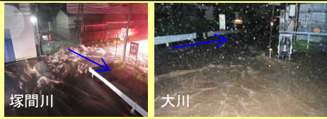
平成25年8月15日豪雨時の溢水状況

近年多発する集中豪雨により、岡谷市街地内において、家屋等の浸水被害が増加 塚間川流域の都市部では、近年浸水被害が発生し、特に、平成25年8月15日豪雨(最大時間雨量72mm)では、床上11戸、床上下33戸の浸水被害が発生