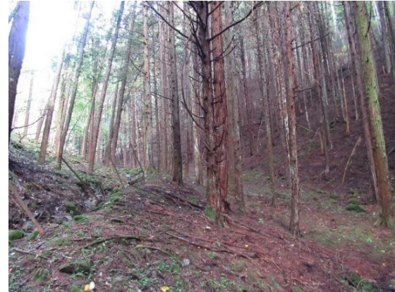
●第1 接合井付近の様子④