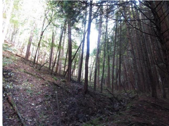
●第1 接合井付近の様子②