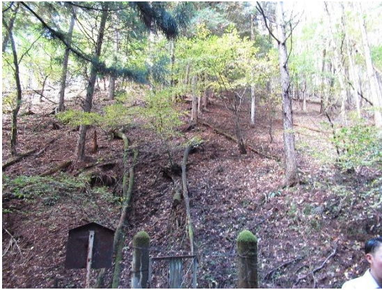
●第1 接合井付近の様子①