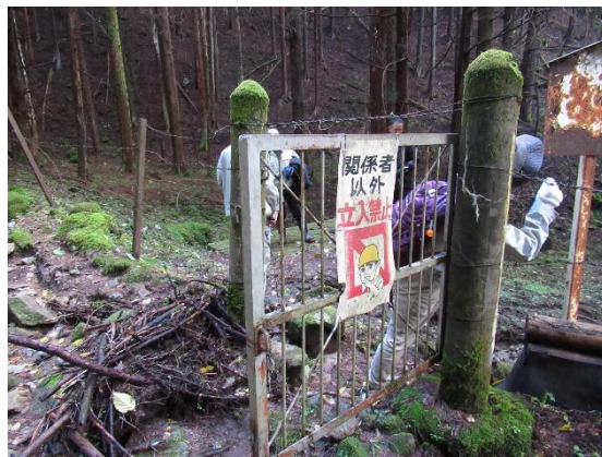
●第1接合井・取水口への入口