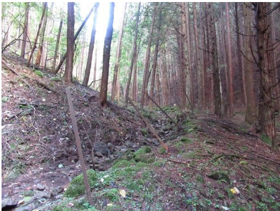
●第1 接合井付近の様子③