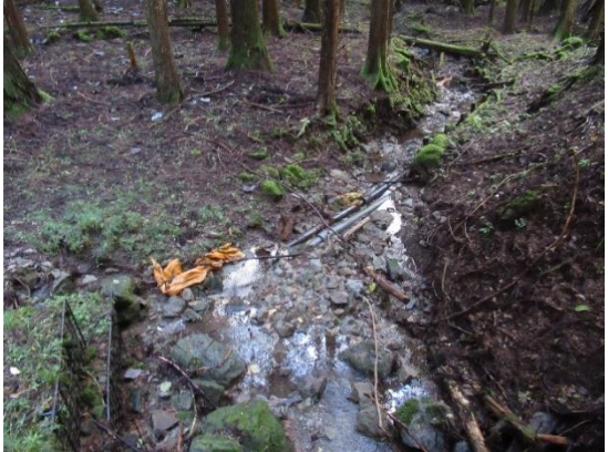
●第1 接合井付近の様子⑤