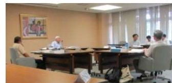
環境影響評価技術委員会（水象部会）