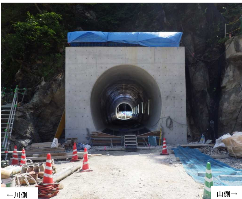
連絡トンネル工事の状況 (下流より) (2019.6.25撮影)