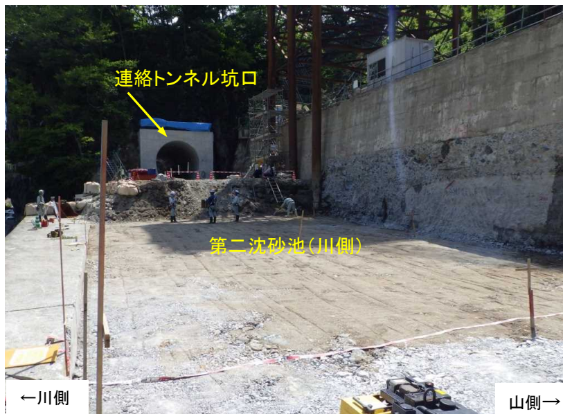
連絡トンネル、第二沈砂池工事 の状況(下流より) (2019.6.25撮影)