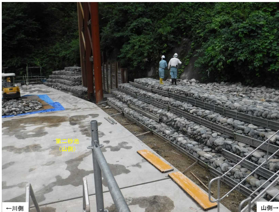
第二沈砂池(山側) 施工状況(下流より)