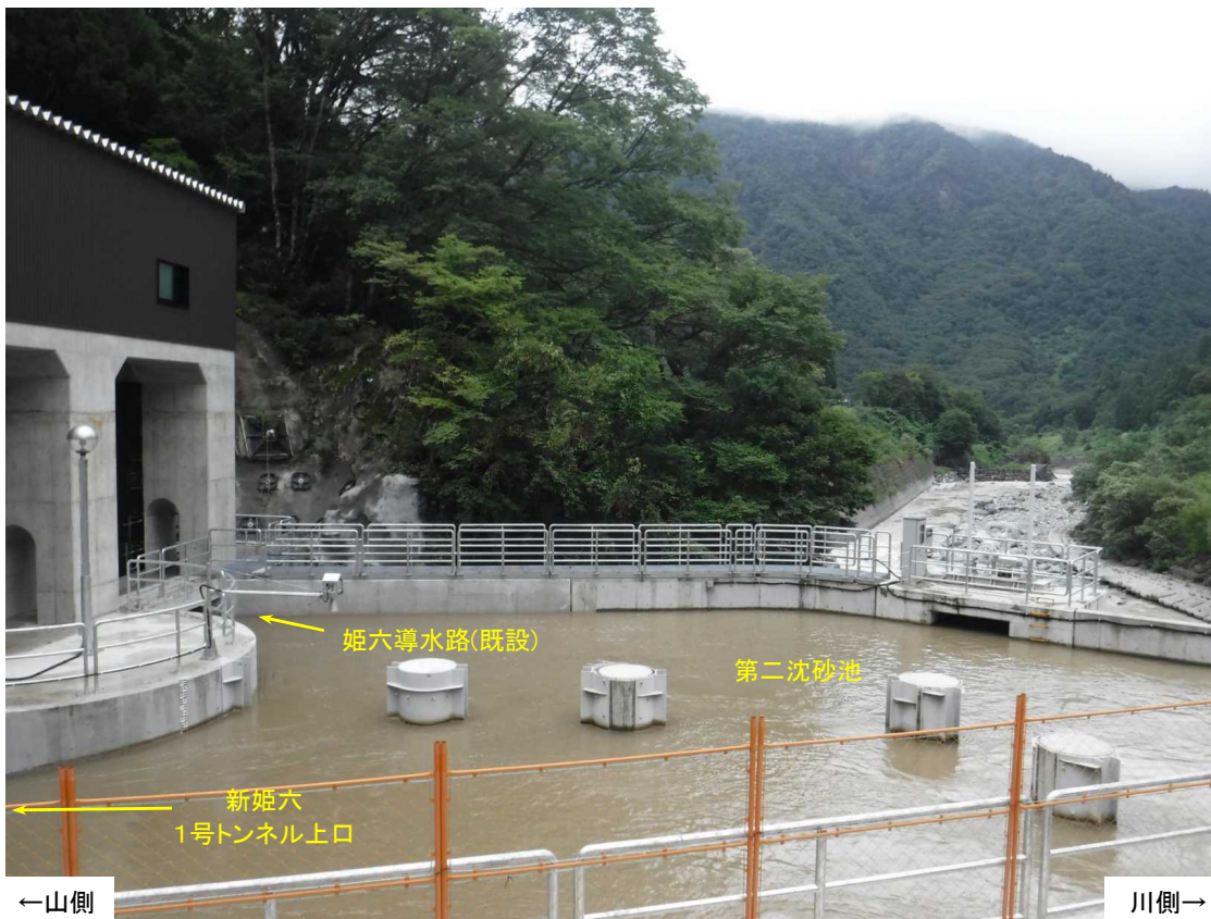
第二沈砂池施工状況 (上流より)