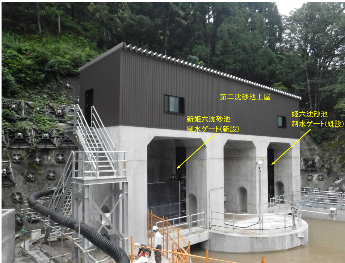
第二沈砂池上屋 施工状況(上流より)